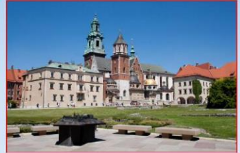
Wawel in Kraków

Besichtigung der Taufkirche und Besuch des eindrucksvollen Museums im Geburtshaus von Papst Johannes Paul II. mit Bildern und Exponaten aus seinem Leben.