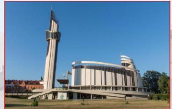
Zentrum der Barmherzigkeit