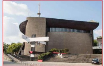
Arka Pana in Nowa Huta