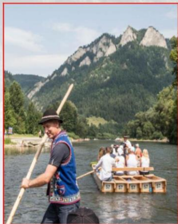
Floßfahrt auf dem Dunajec